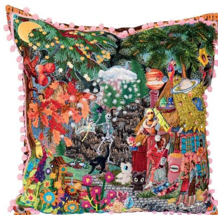
Jutta Kohlbeck: Once Upon Today

Ať už objekty k zavěšení na stěnu nebo trojrozměrné objekty – z bývalých výrobků masové produkce vznikla jedinečná, individuální díla pramenící z umění i kýče, ducha dnešní doby, klasiky i aktuálních pozic. Textilní výtvoř, které nás dnes osloví.